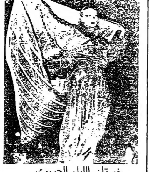
فستان الليل الحريري

المصمم الياباني اسي ميياكي قدم مؤخرا في باريس مجموعته من ازيائه موسم الخريف - والشتاء . وفي الصورة اعلاه فستان من الحرير يصلح لليل ( صورة من أ.ب. ) .